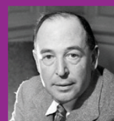
Клайв Стейплс Льюис

ЦИТАТА НОМЕРА: Если человек не обращается к Богу в малых нуждах, он не будет знать, как это делается, когда придёт беда. Кто не научился просить о детских вещах, не будет готов попросить о крупных... Мне кажется, от небольших молитв нас подчас удерживает ощущение не Божьего, а своего величия.