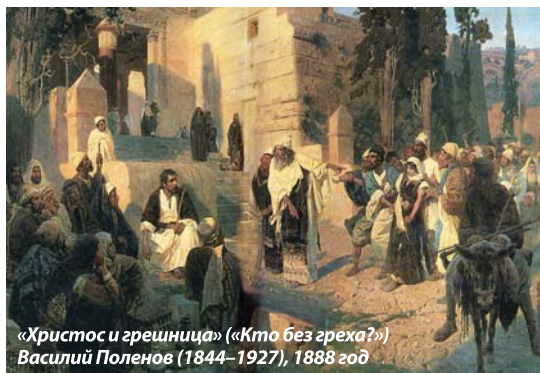
«Христос и грешница» («Кто без греха?») Василий Поленов (1844–1927), 1888 год

Ещё несколько должностных лиц осматривали её, но так и не отважились включить в каталог выставки. Президент Академии художеств заключил, что «для образованных людей картина интересна своим историческим характером, но для толпы vesz-