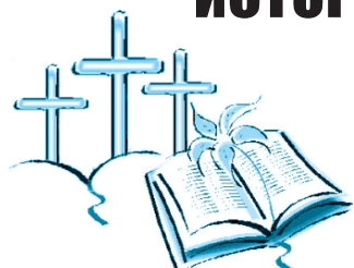
ЕВАНГЕЛИЕ ОТ ЛУКИ 2 ГЛАВА

1 В те дни вышло от кесаря Августа повеление сделать перепись по всей земле.