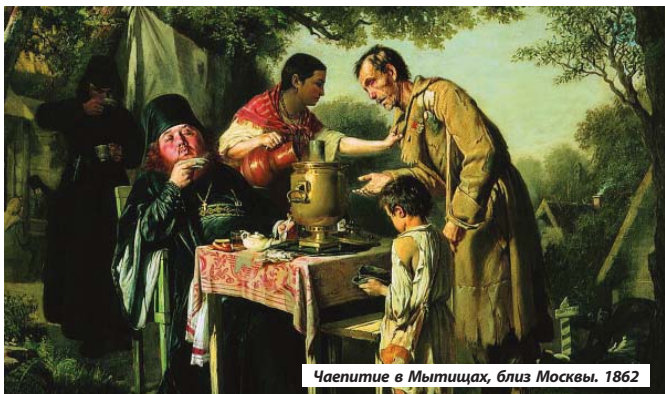
Чаепитие в Мытищах, близ Москвы. 1862

Подготовила Елизавета Черникова Использованы материалы статьи искусствоведа и в.н.с. Государственной Третьяковской галереи М. В. Петровой