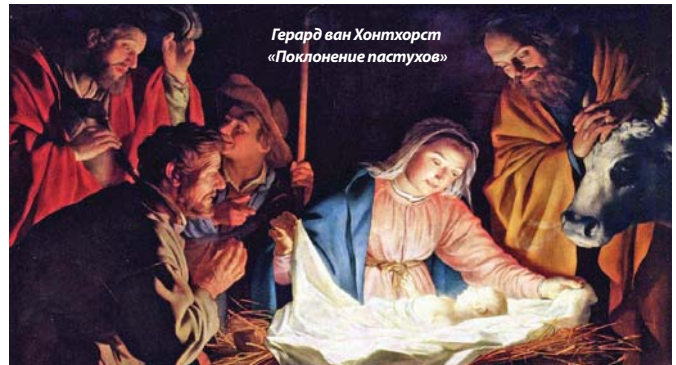
Герард ван Хонтхорст «Поклонение пастухов»

Нам нет нужды оставаться жертвами змея, сатаны. Бог положил вражду между людьми и лукавым. Мы можем освободиться из-под его контроля.