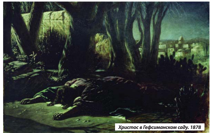
Христос в Гефсиманском саду. 1878

А чуть раньше, в 1878 году, с мольберта художника сошло полотно «Христос в Гефсиманском саду» —