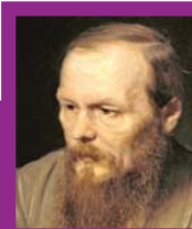
Фёдор Михайлович Достоевский

ЦИТАТА НОМЕРА: Кто хочет приносить пользу, тот и с буквально связанными руками может делать бездну добра.