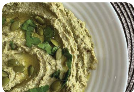
ПАШТЕТ ИЗ ТЫКВЕННЫХ СЕМЕЧЕК

Что намазать на хлеб? Паштет из семян и бобовых — это не только источник белка, но и полезная вкуснятина.